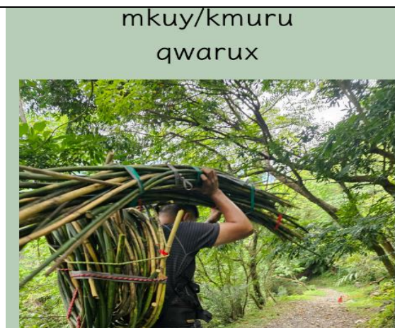
期末報告 田野調查結果 報告者：林庭瑜同學