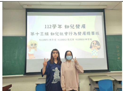
幼兒發展五分鐘精華版口頭報告