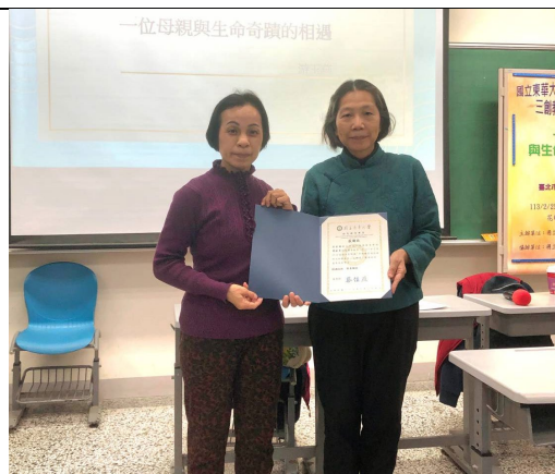
授課教師頒發感謝狀