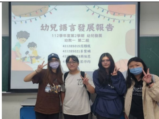
幼兒發展主題報告