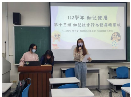
各組針對報告組別給予的回饋