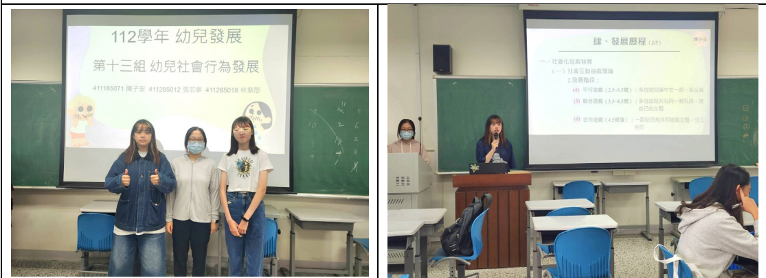
第十三組報告組員之團體照