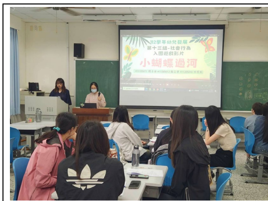
修課同學觀看入園遊戲影片