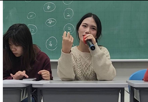
我的童年發展口頭心得分享