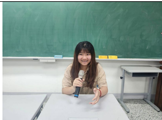
同學分享童年發展經歷