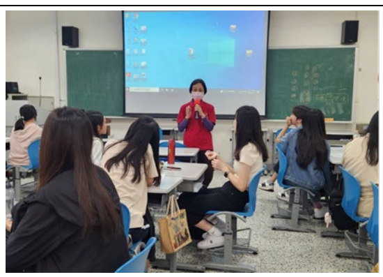
授課教師給予報告組別的回饋