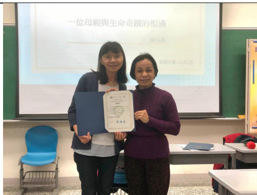
授課教師頒發感謝狀