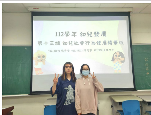
第十三組組員精華版報告之團體照