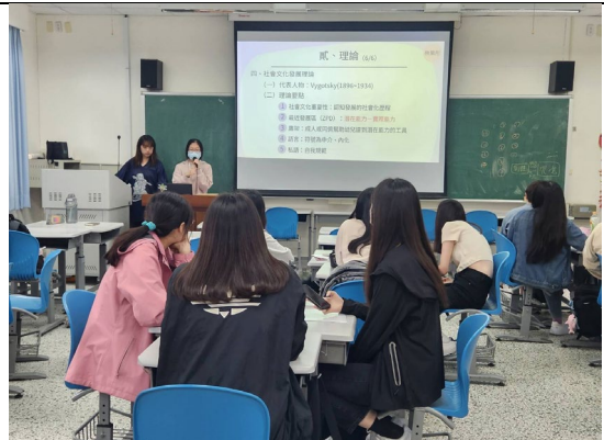
同學講述幼兒社會行為的理論