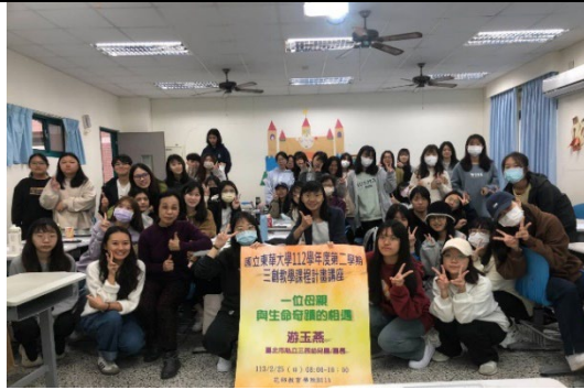
113/02/25 教育講座團體照 一位母親與生命奇蹟的相遇