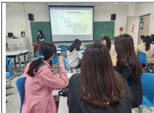
同學線上講述幼兒社會行為的重點