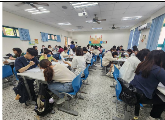
台下同學靜心聆聽分享