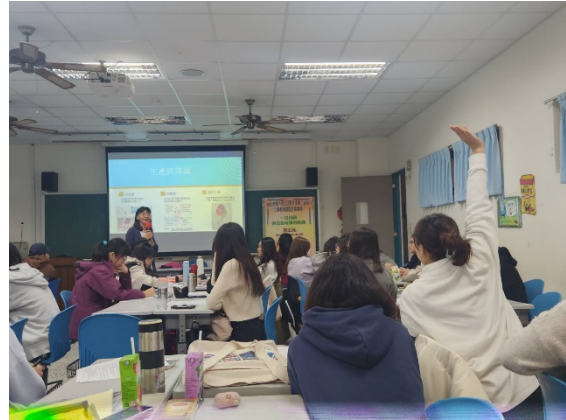
同學踴躍向講師提問