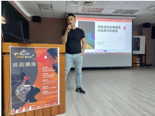
林光亮導演分享如何履行青年義務