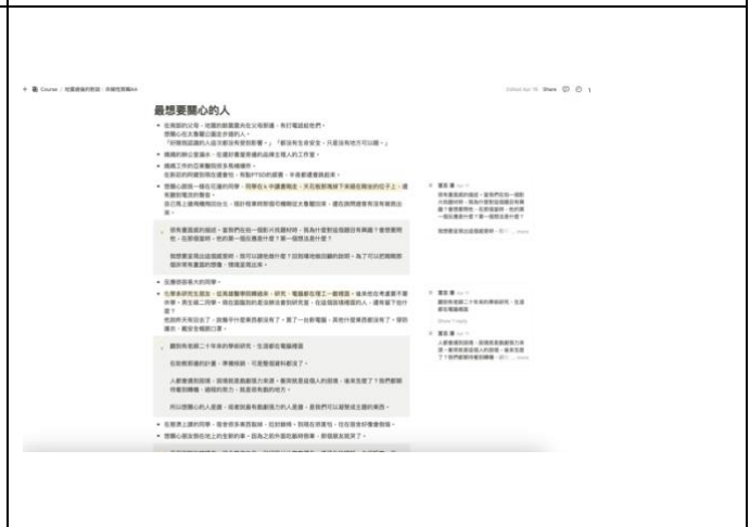
同學們參與線上討論紀錄節錄