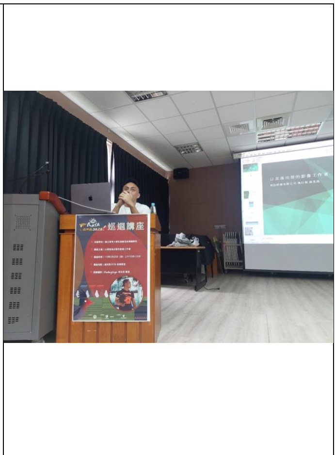
講座活動宣傳海報