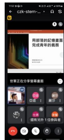
林光亮導演與線上參與講座同學