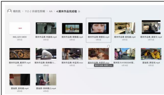
AA 班期末成果影片檔案線上繳交