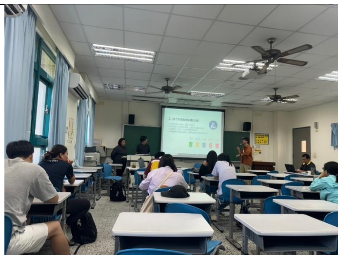
同學們結合自身專業與學科知識，設計不同的方案進行報告