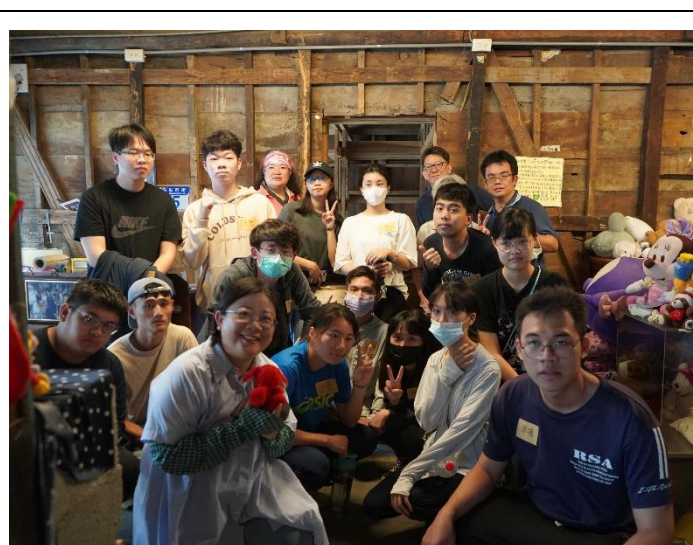
於五味屋的娃娃屋，與工作人員合影