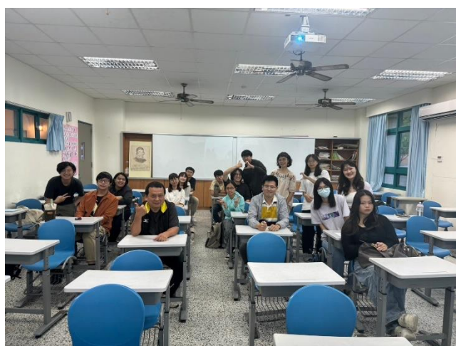
講座活動結束後，講師與同學們合影