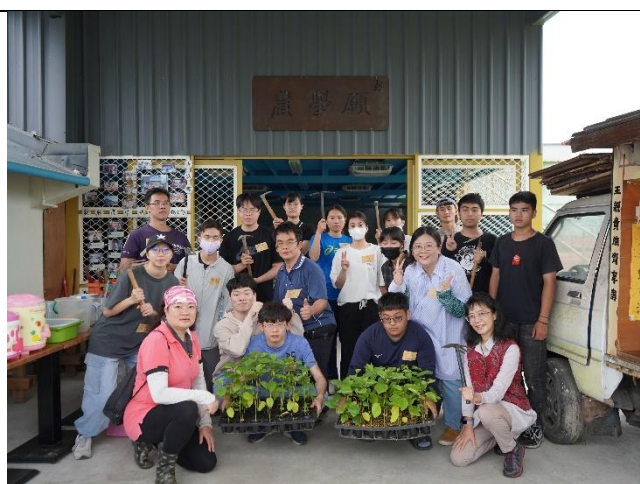
學生參與五味屋洛神花活動，與當地孩子們合影