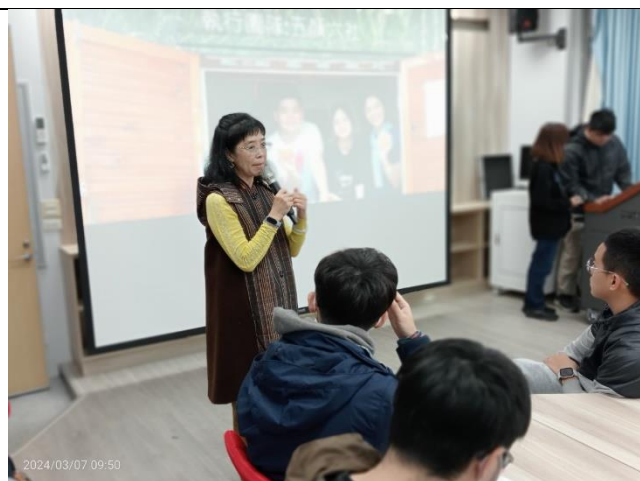
顧老師說明甚麼是社區方案