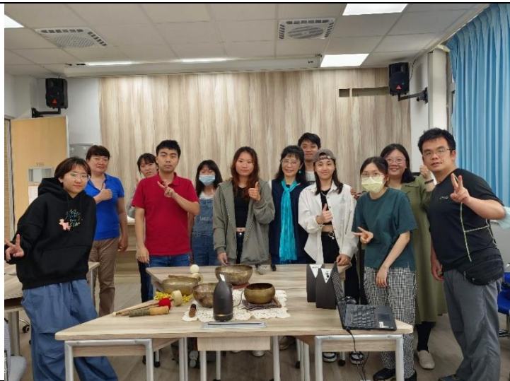
從震災看見地方的需求進而成為地方需要的協力者