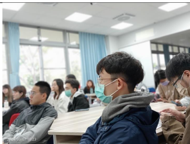
同學們仔細地聆聽