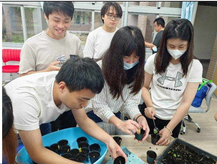
學習洛神花苗定植