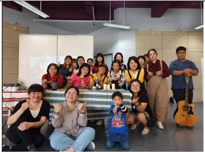
同學們與參與體驗者及講師們的大合照