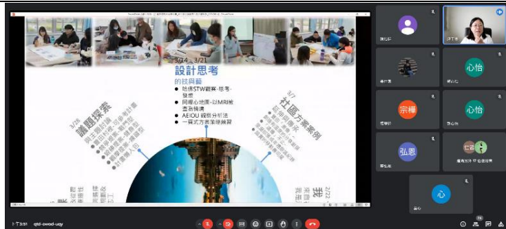
期末成果發表會截圖