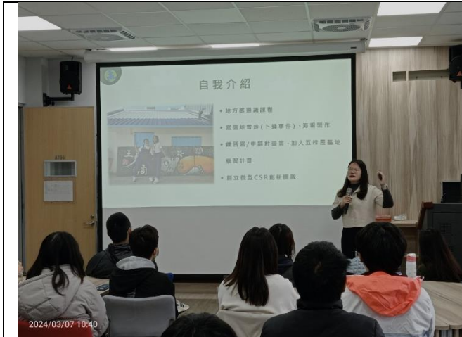
學長姊的社區方案案例-踏實的移動壽司屋 附件一