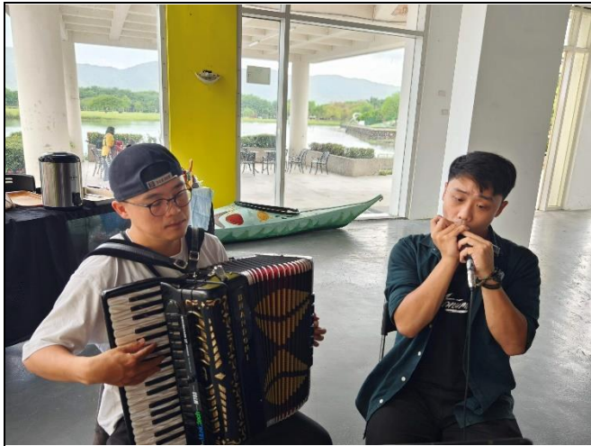
課程學生的現場演奏表演