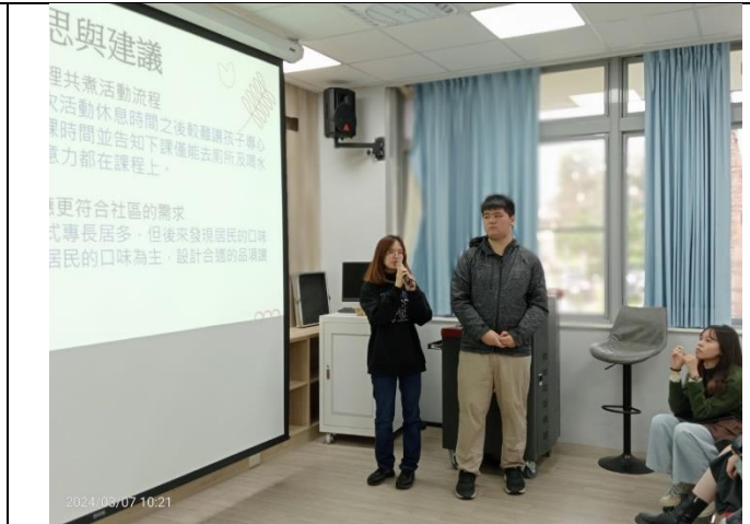
學長姊的社區方案案例分享-豐田煮憶