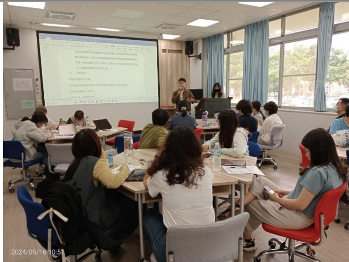
分組討論及方案介紹