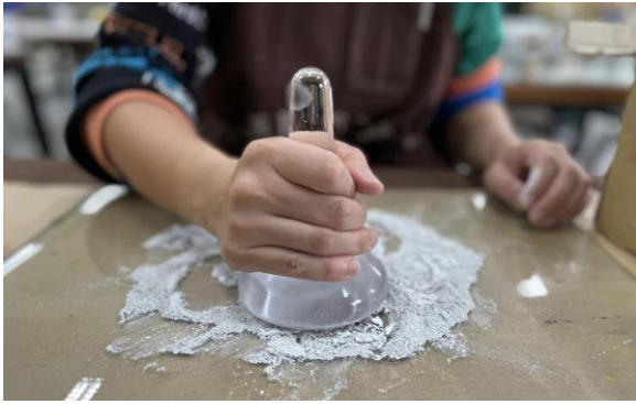
研磨成可用之色粉