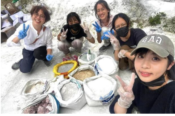
老師與同學到石材場採集石粉污泥