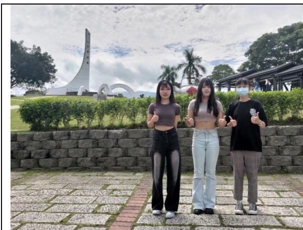
台東藝術之旅 (0512) 台 9 線 北迴歸線上