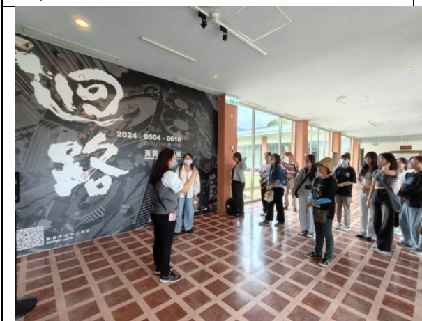
台東藝術之旅 (0512) 台東美術館參訪