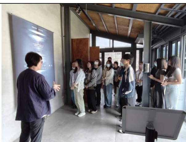
台東藝術之旅 (0512) 池上穀倉藝術館參訪