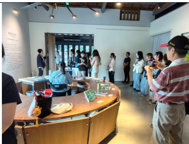
台東藝術之旅 (0512) 池上穀倉藝術館參觀