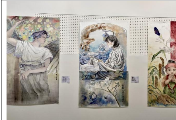
學生成果展覽的作品