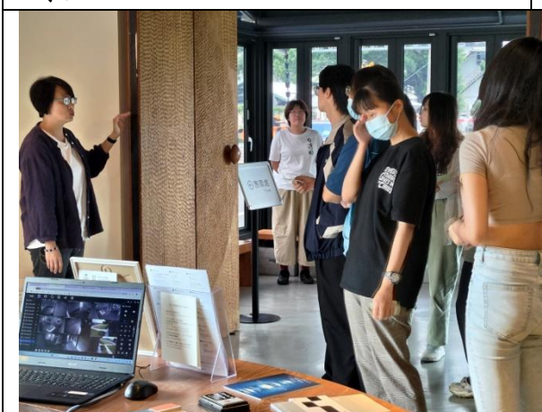
台東藝術之旅 (0512) 池上穀倉藝術館參訪