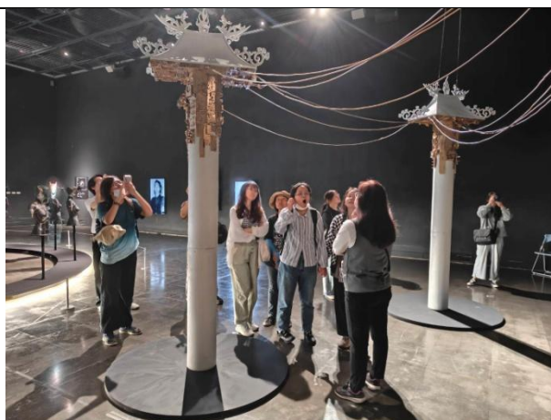
台東藝術之旅 (0512) 台東美術館參訪