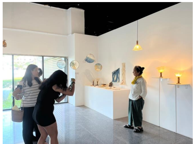
團隊拍攝影片用素材