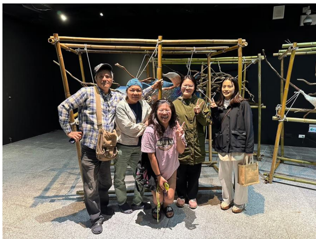
學生協助藝術家佈展