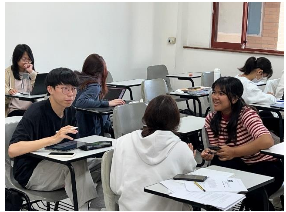
圖片說明：2024年3月28日，課堂中學生分組討論。