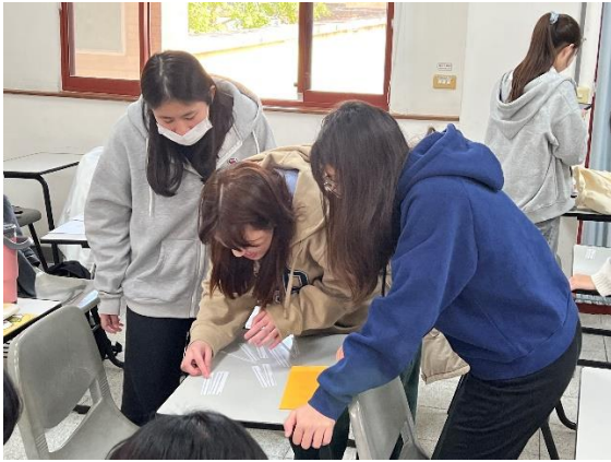
圖片說明：2024年3月14日，課堂中學生分組排列句子。