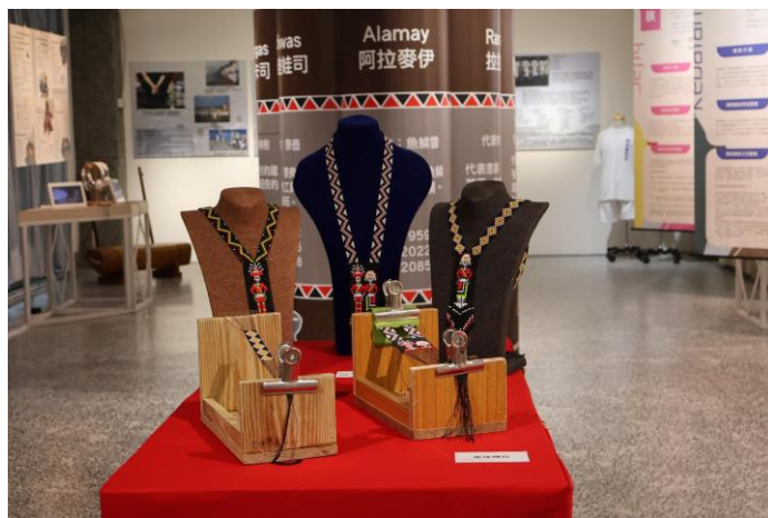
同學及老師的合照