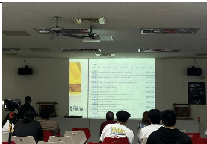
展示國網中心研發的族語 AI 技術