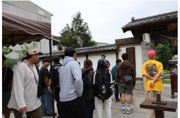
導覽員介紹慶修院與同學們認真的神情