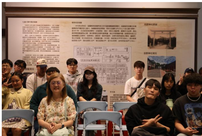
同學及老師的合照