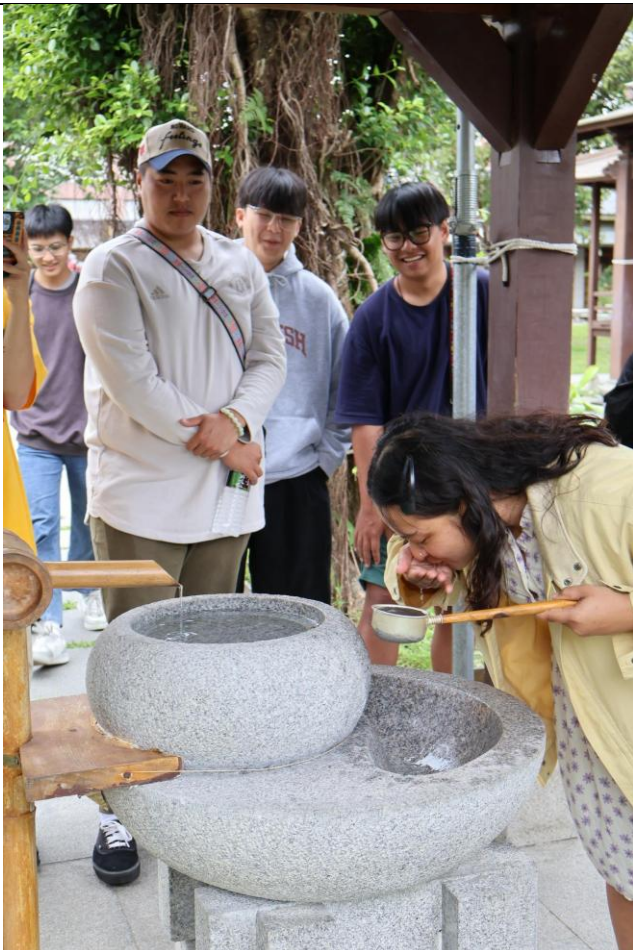
同學體驗日本參拜儀式（手水舍淨心淨身）