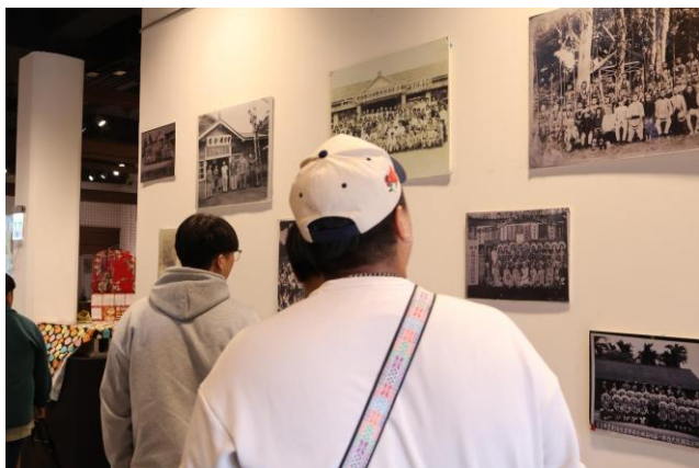
吉安好客藝術村門廊留下了許多七腳川歷史事件相關照片