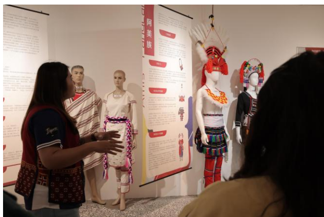
同學們積極的討論不同族群的服飾意義