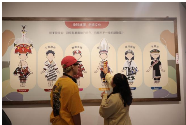
活潑的導覽員介紹吉安鄉好客藝術村