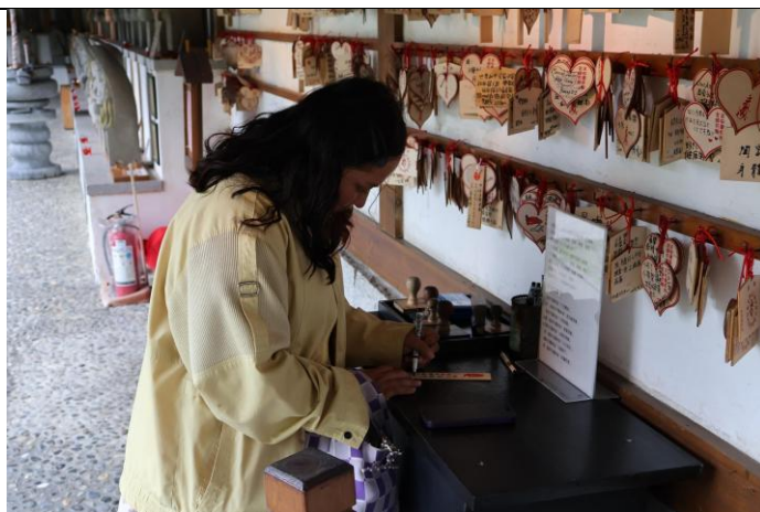
同學把願望寫在繪馬上，將願望傳達給神明