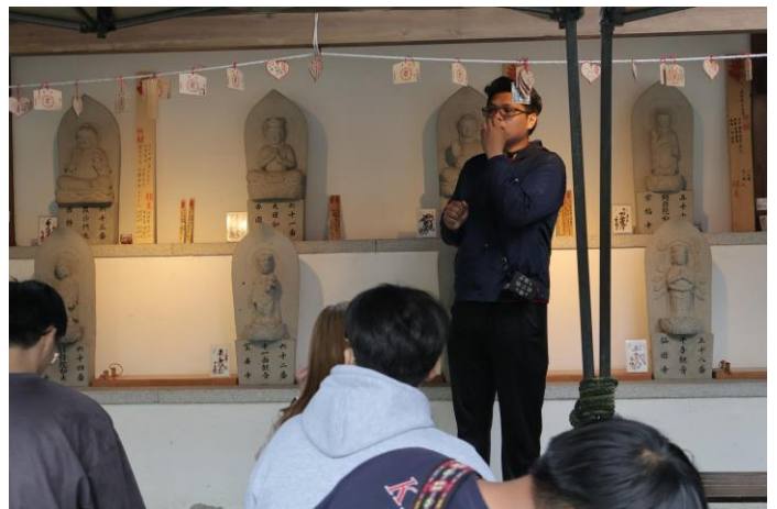
介紹神社八十八尊石佛