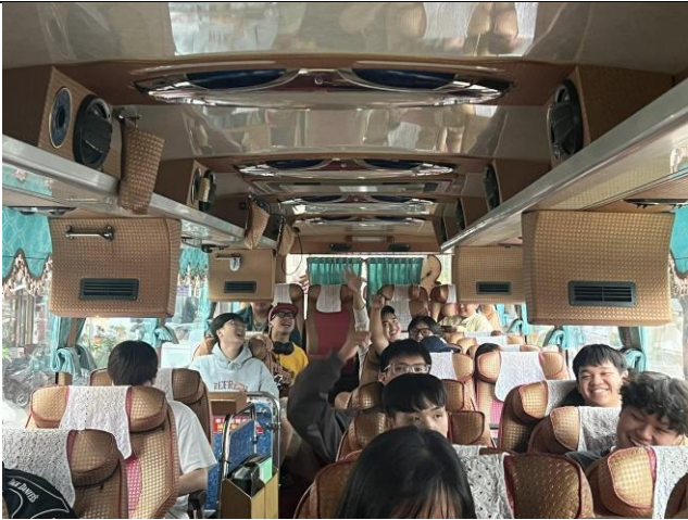
出發前同學們開心的合影