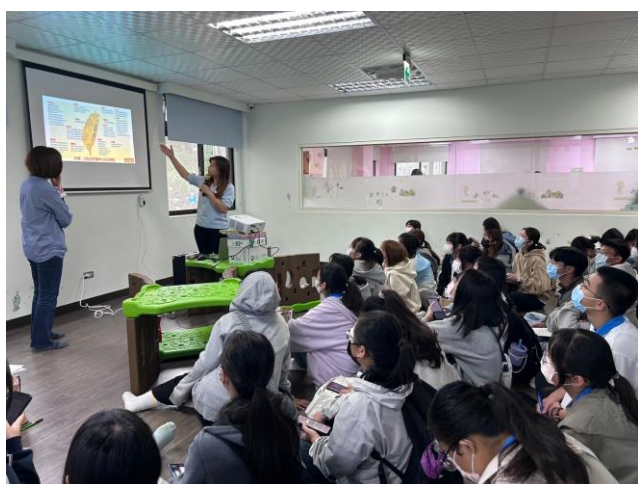
老師像我們介紹托嬰中心的實務與環境。