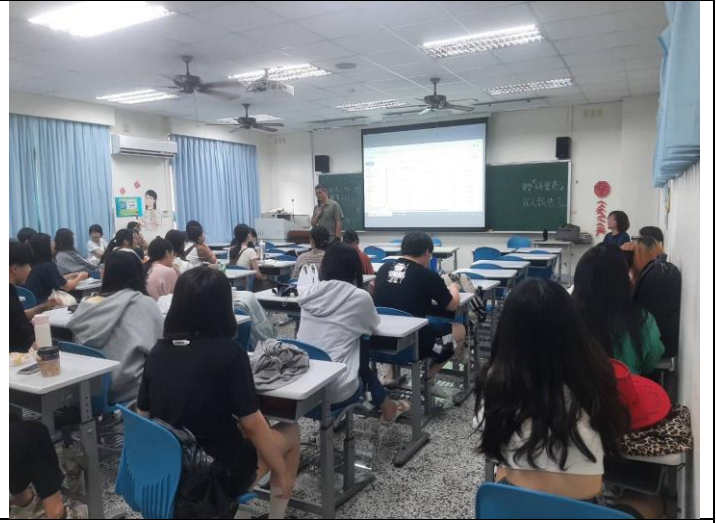
Q&A 交流環節，與老師相互討論困惑的問題。