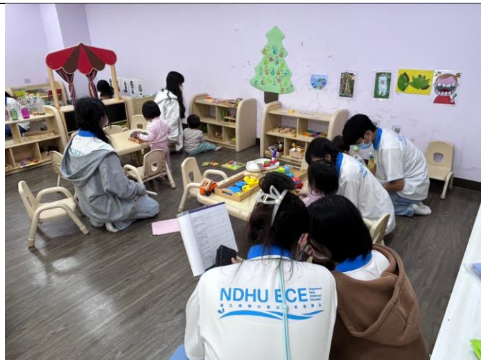
透過檢核表探討托嬰環境的規畫需求。