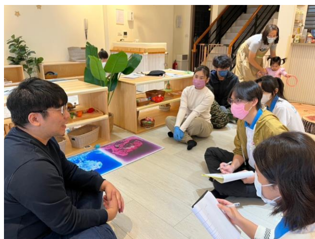
Q&A 交流環節，向老師請教觀察時的發現。