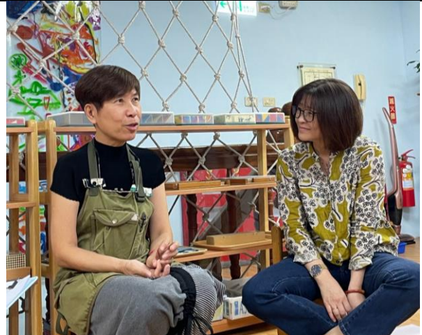
Q&A 交流環節，向老師提問困惑的問題。