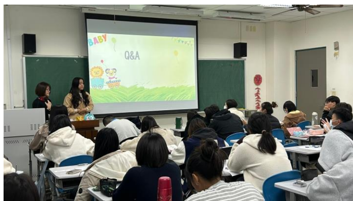
Q&A 時，老師與我們討論突發情境的應變方式。