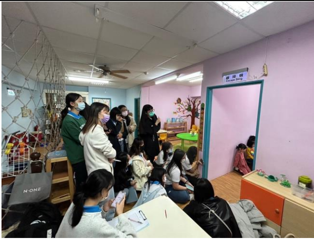
觀看蒙氏教具的操作過程。