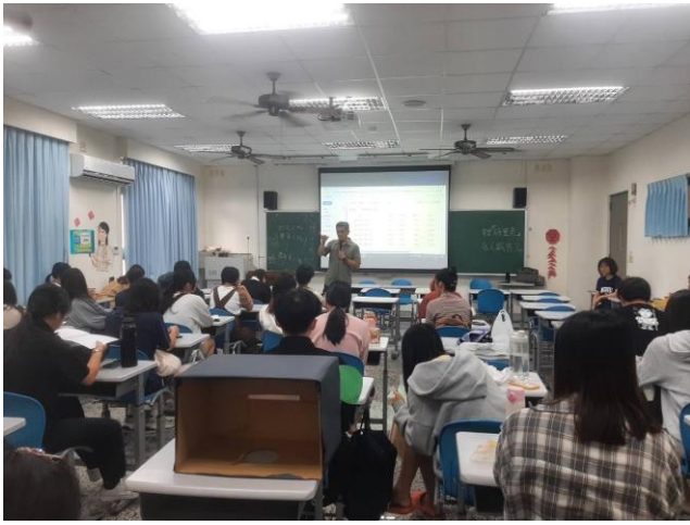
活動初期先介紹基本理論以及遊戲實務。