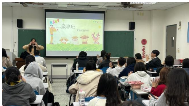
與老師一起學習如何使用手指謠。