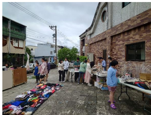
進行化仁五味屋之冬季特賣會