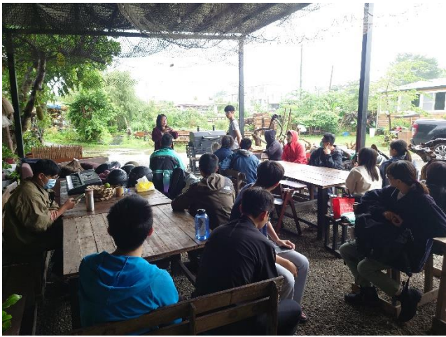
介紹菜園經歷與歷史