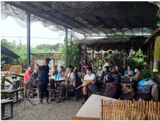
祖裔斯老師介紹阿美族野菜