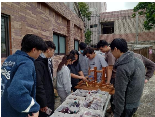
學習阿美族文化中的編織