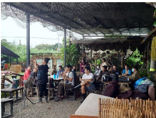
於部落菜園中進行苧麻編織教學