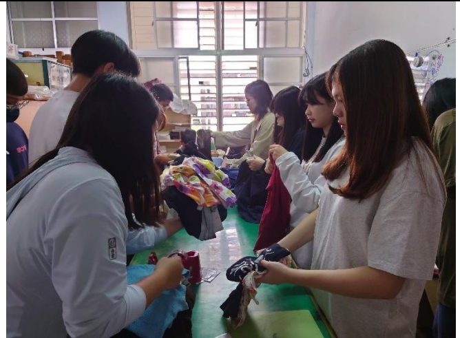
實作化仁五味屋營運