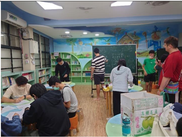
討論與書寫彼此於部落所見