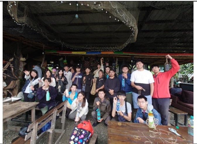
展示苧麻水壺套作品