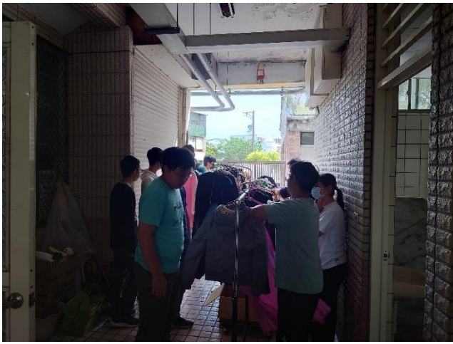
化仁五味屋開店準備