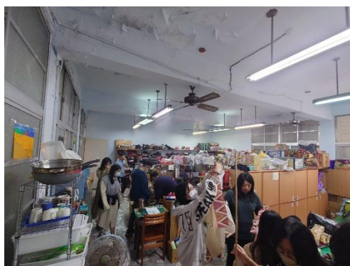
於化仁五味屋與部落學童進行交流與進行店務