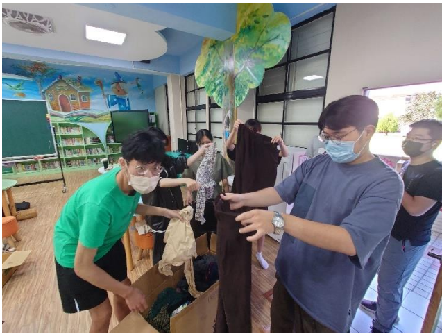
與部落學童一同籌備冬季特賣會