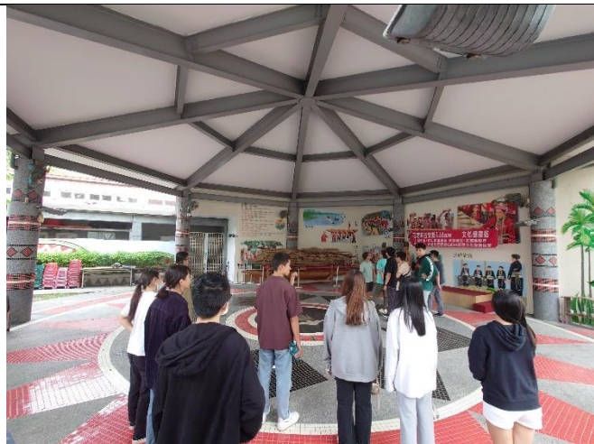
於部落參訪 (里漏部落聚會所)