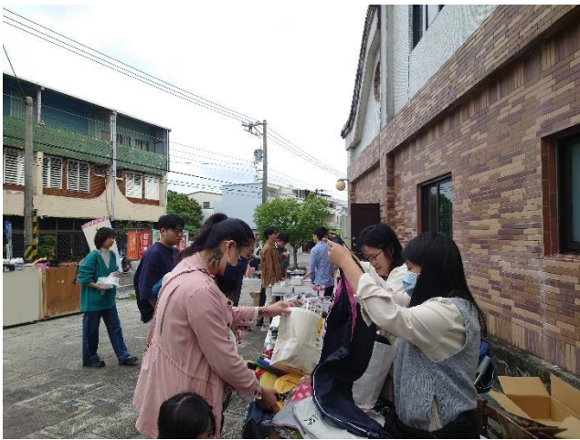
擺攤中，與部落互動