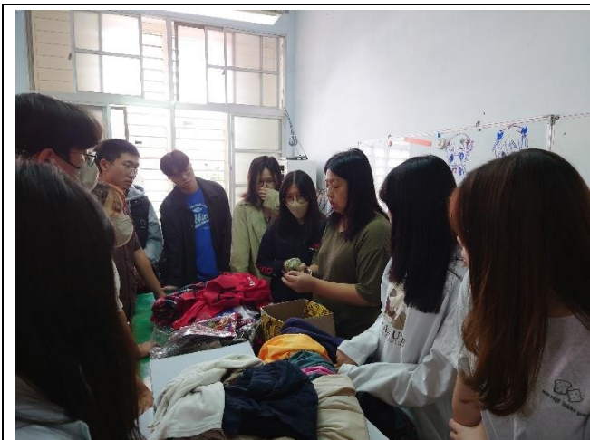
老師解說如何使用標籤機標價