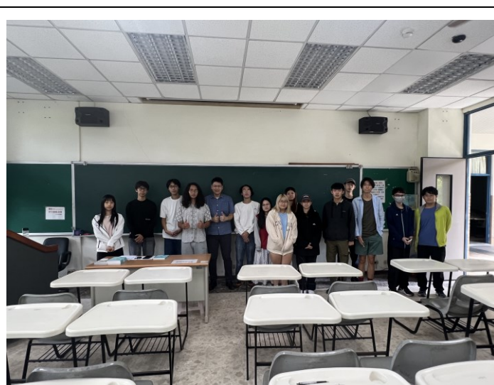
主講人與修課同學合影