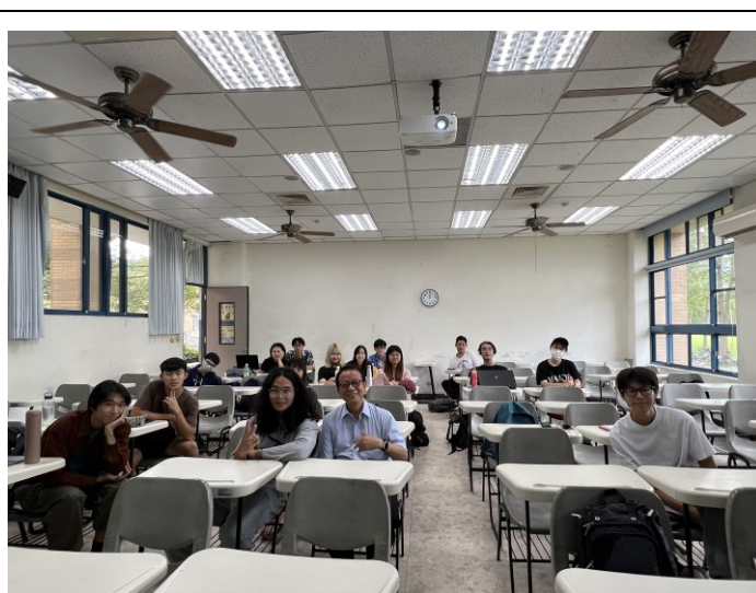
主講人與修課同學合影