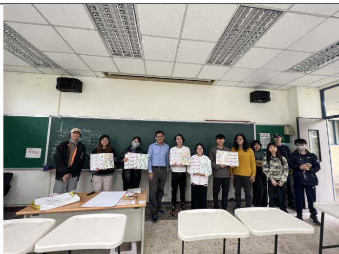
主講人與修課同學合影(手拿桌遊遊戲)