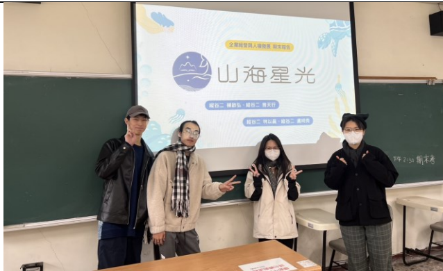
期末報告第一組山海星光