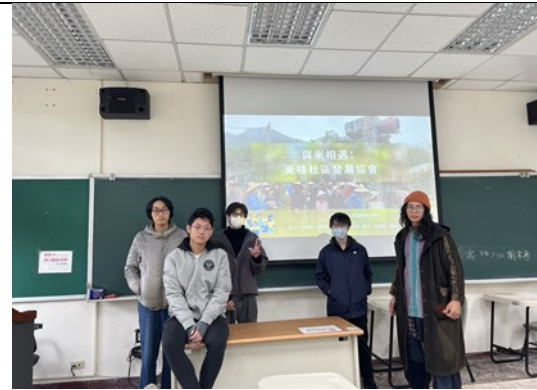
期末報告第二組米棧社區發展協會