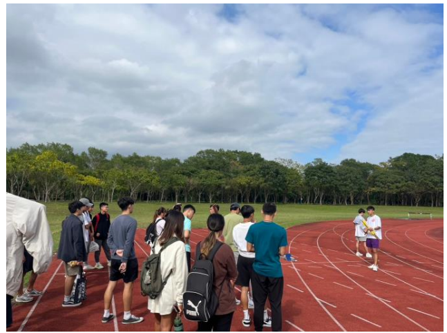
林國華田徑老師協同教學-田徑裁判執法 重要性與精神