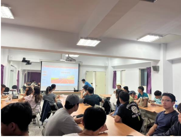
講師講解田徑裁判的工作內容