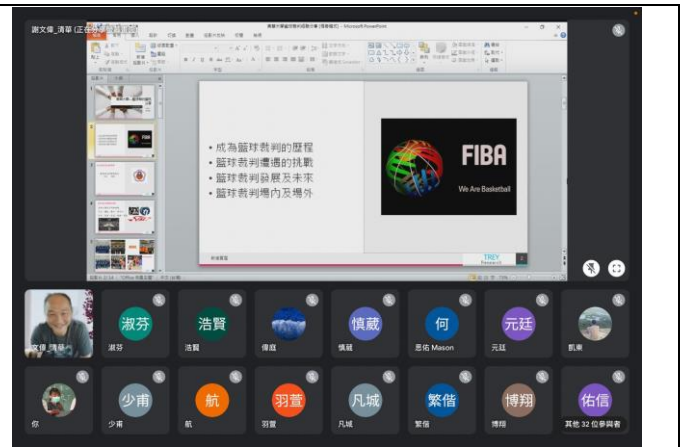
講師說明籃球裁判的大小事