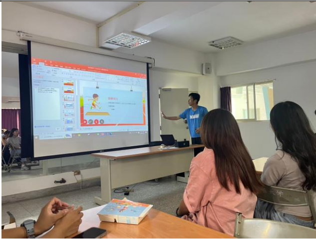
講師說明田徑項目分類