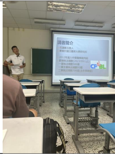
講師向大家自我介紹