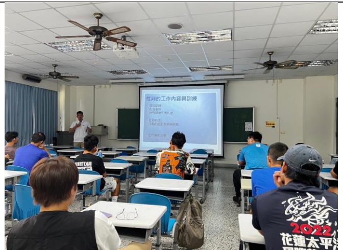
講師講解裁判的工作內容與訓練