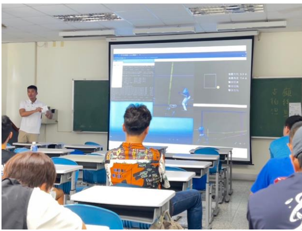
講師講解科技輔助判決