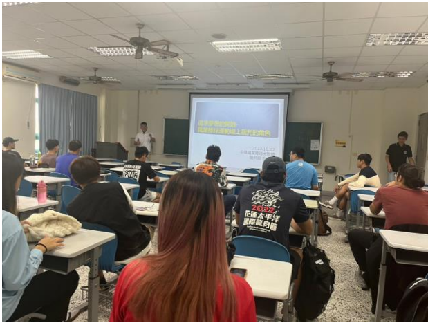
每位同學都相當認真準備聽講