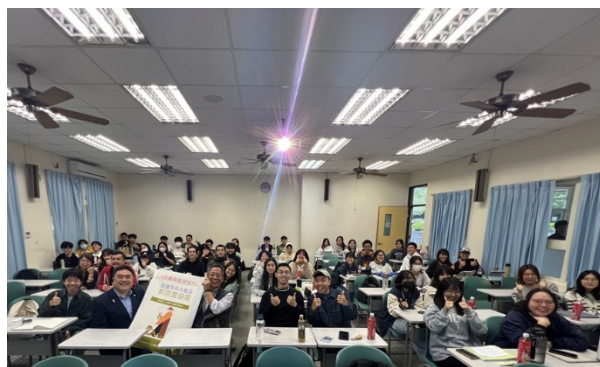
校友職場經驗分享(2)