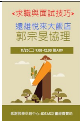
校友職場經驗分享(3)