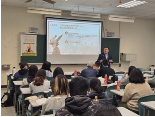
校友職場經驗分享(1)