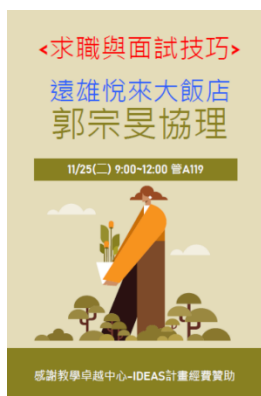
校友職場經驗分享(3)