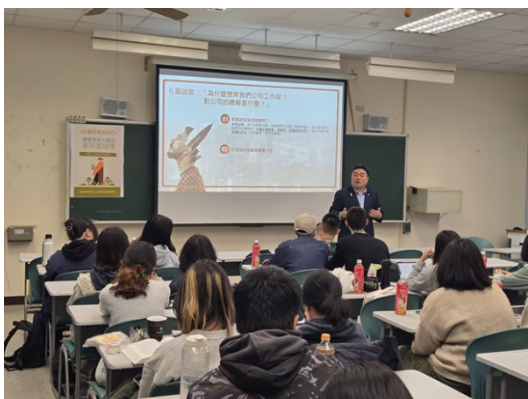
校友職場經驗分享(1)