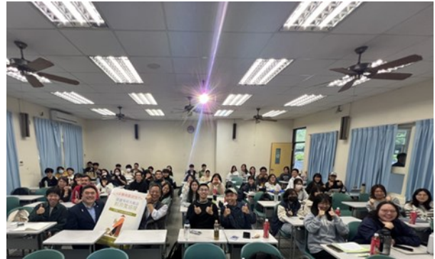
校友職場經驗分享(2)