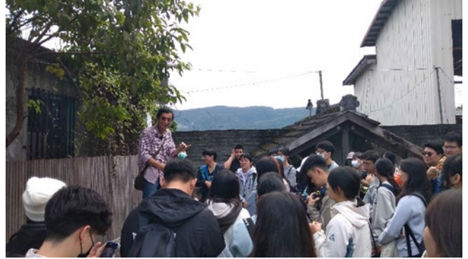
豐田移民指導所前小廣場，鴻圖老師正在向同學導覽解說，並向同學拋出問題，思考文化資產如何活化的議題