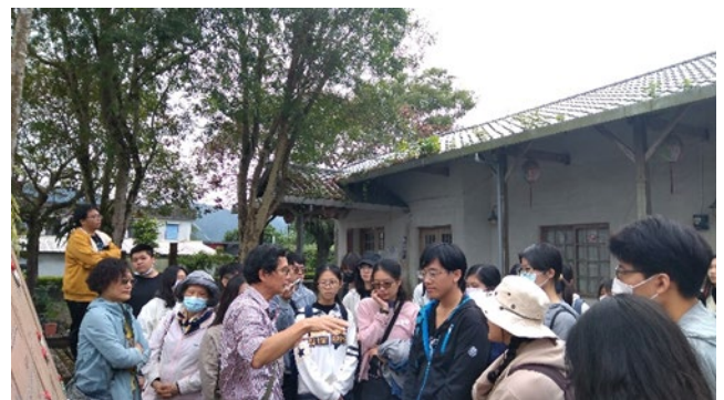
壽豐文史館前廣場，鴻圖老師正在向學生們導覽解說豐田移民村的歷史發展與變遷