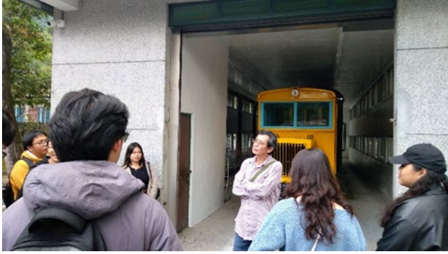
林田山林業文化園區內，師生們吃完午餐便當，在園區自由走逛，互相分享彼此對於林田山的想法