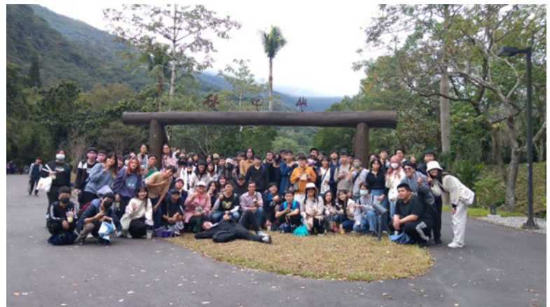
充實的戶外教學結束，在林田山林業文化園區地標合影