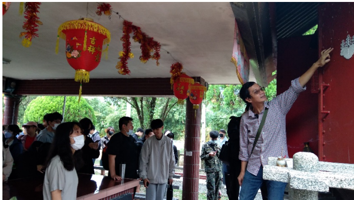
鴻圖老師正在講解共和村福德宮上的「五七之桐」的徽章