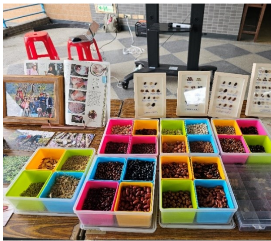
活動剪影(請檢附二至四張活動照片，並予以簡述)

意見與回饋 對於現在的大學生來說，耕作、農業是有距離的，很多時候是透過想像一個畫面或一個片面的感受，我們從書本上可以看到很多的定義和耕作理論及描述，但與真實在耕作的人們或許是有落差的，當部落的族人來到課堂分享他所想所做，拓展同學們的視野，使我們有更真實的認識，同時我們看到物品並操作，讓學生延伸思想傳統與現代共存的可能性以及環境永續的議題。 其他 本課程帶學生認識花東進行物種保護或棲地保育實踐的社區，訓練學生能夠傾聽社區情況而意識實務上的真切課題，也透過地方業師共同設計讓學生能夠達到換位思考之能力，讓學生具備理解現場情況之能力。期望推動全民原教的脈絡，讓原住民的教育不只對原住民，而是面相整個全校的學生，可以使大家知道環境議題、能源使用、氣候變遷都與原住民很有關係，而不只存在傳統文化或樂舞。