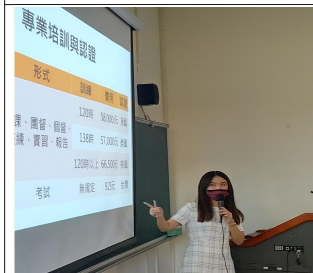
分享國際職涯諮詢課程內容