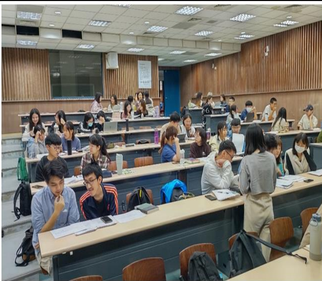
平常上課採分組方式進行 (於人二第四講堂)