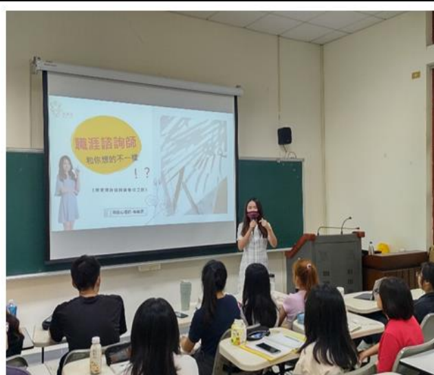
認識職涯諮詢師活動