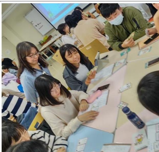
分組操作牌卡，講師於各組間穿梭了解適時指導