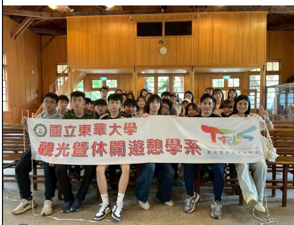
在林田山同學們大合照。