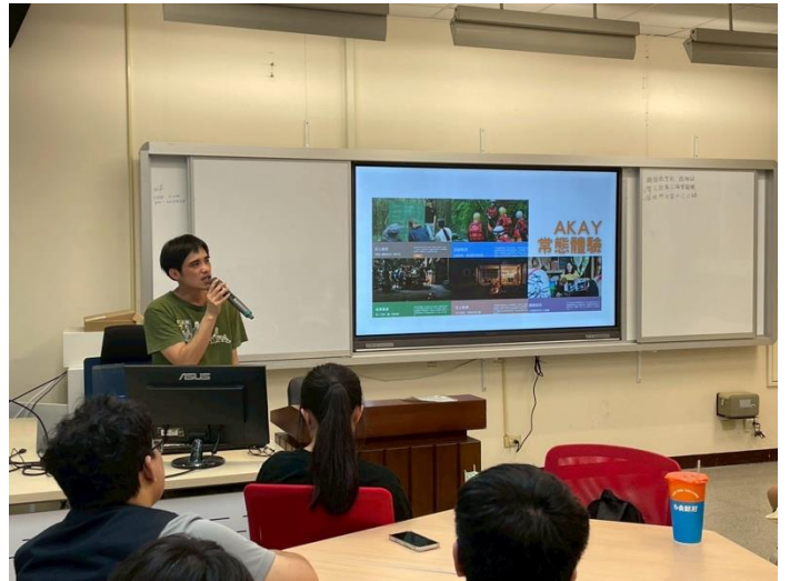
講者介紹阿改玩生活的現有活動。