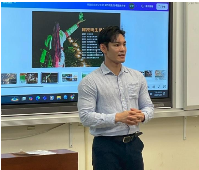
老師向大家介紹講者以及今天主題。