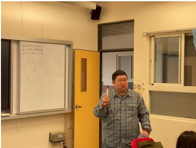
講者舉出實際案例和同學討論。