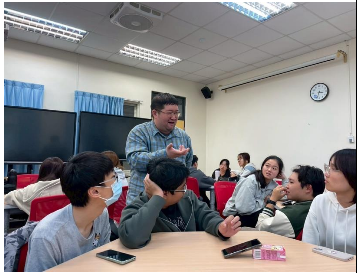
講者給予同學們回饋以及建議。