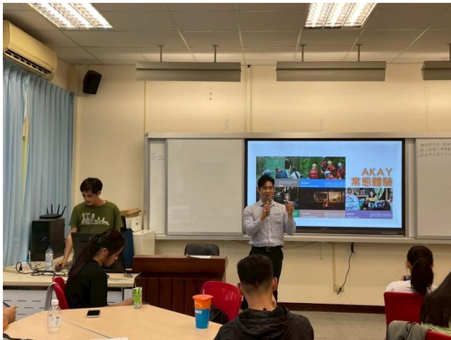
老師和講者相互帶領同學發想問題以及解決方案。