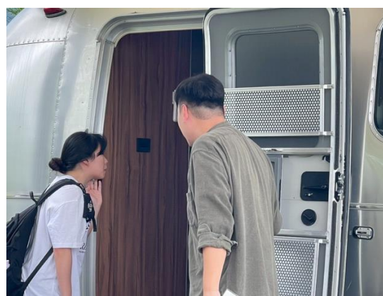
講者向同學介紹露營車設備。