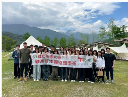
東華大學觀光暨休閒遊憩學系參訪師生於松邑莊園大合照