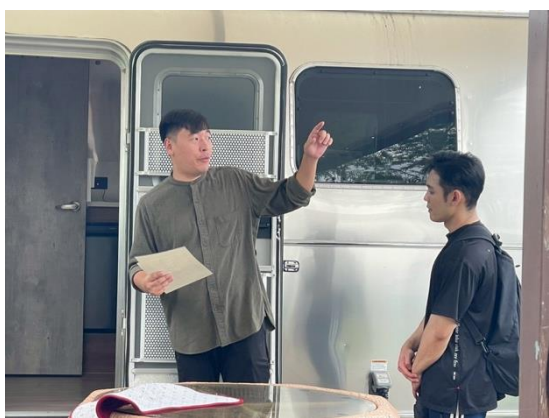
講者介紹莊園場地。