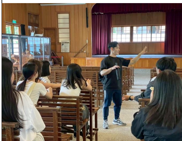
老師介紹林田山的歷史、特色。