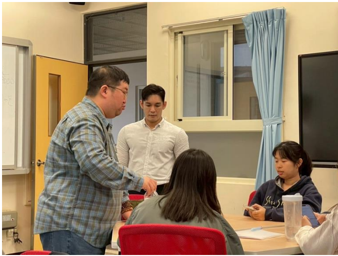
講者和老師相互引導同學發想。