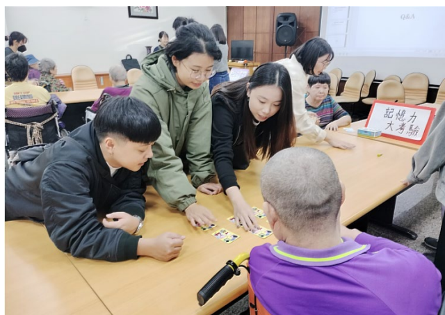
學生用紙牌考長者的記憶力