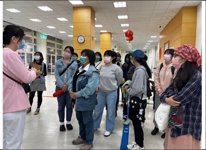
參訪榮家的保健中心