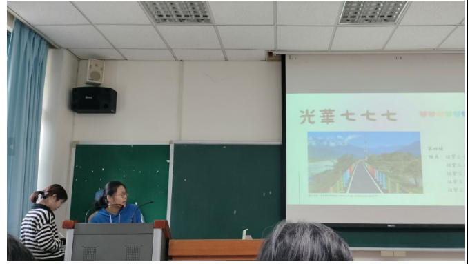
學生提案為光華社區彩虹橋增加新亮點