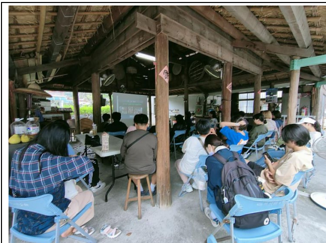
師生在傳統茅草屋下聽取簡報