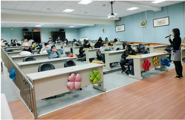
師生聽取榮民之家的簡報與影片介紹