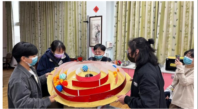
訓練長者合作協調的遊戲，連學生都玩得很開心