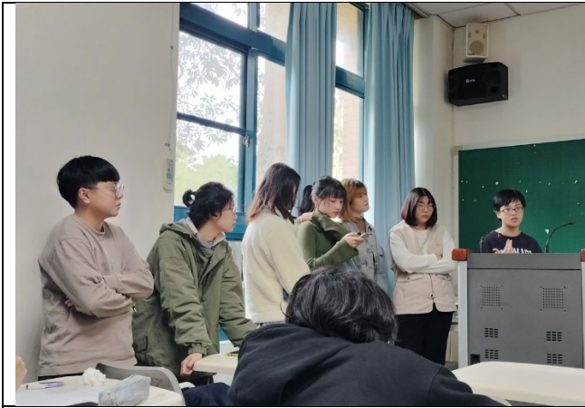
報告小組全員出動等著上場