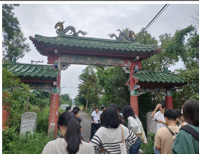
光華村牌樓前的解說，牌樓上的雕刻展現榮民當年開墾的龍馬精神