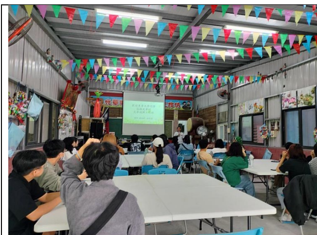
師生聽取光華城鄉發展協會簡報