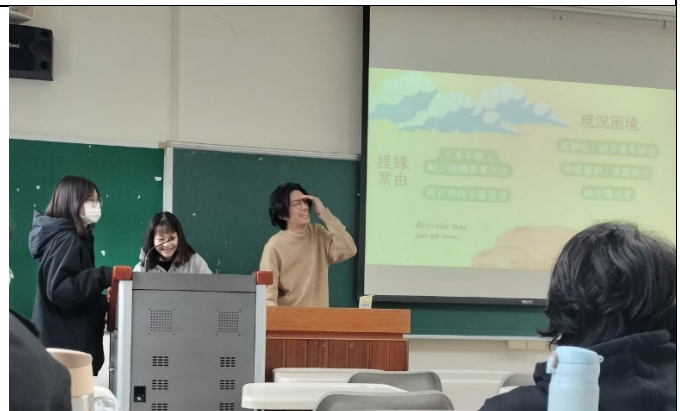
學生說明對社區現況的觀察時因緊張說錯社區名稱而笑