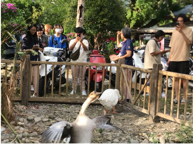
學生到初英山，都被活潑的鵝所吸引