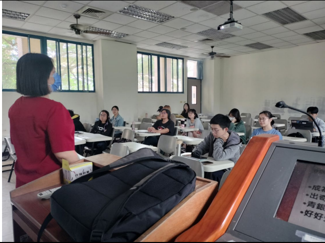
學生認真聽業師分享