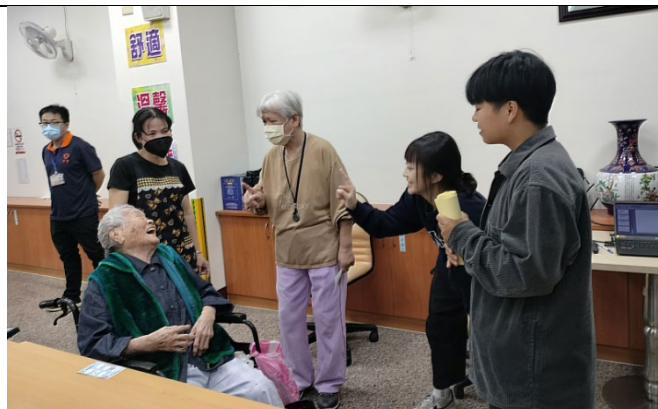
玩猜謎遊戲，長者開懷大笑