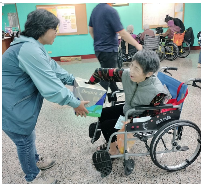
闖關完成的長者笑著抽取小點心