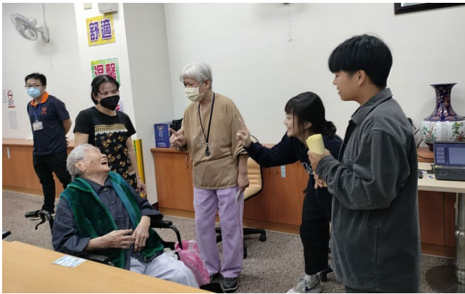
學生跟吉豐養護中心的長者玩猜謎遊戲，長者開懷大笑