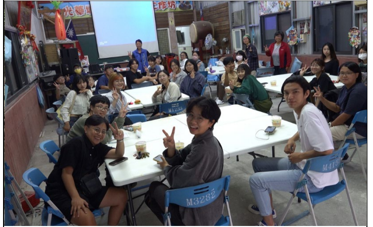
光華村參訪大成功