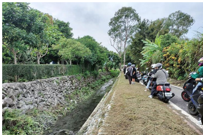
光華社區自行車道旁可以看到以疊石工法整治的水圳