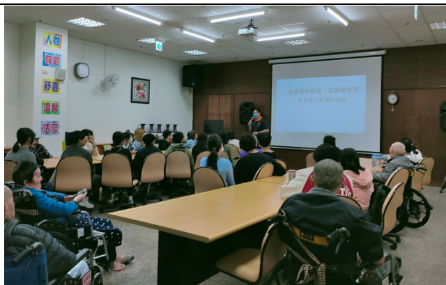
吉豐養護所的住民早早就在等師生到機構，陪著學生一起聽簡報