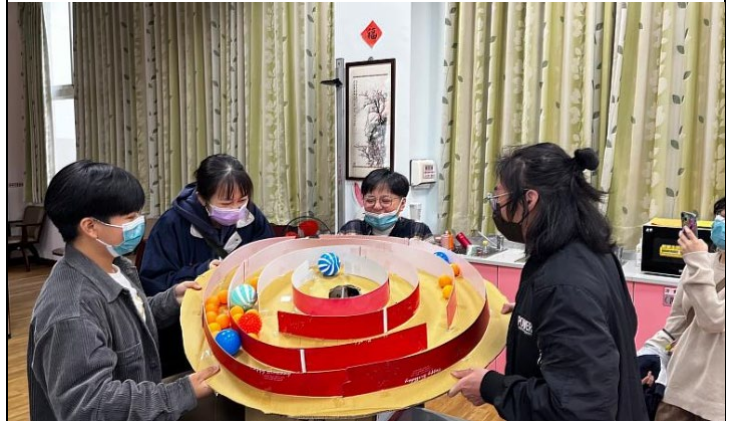
訓練花蓮榮民之家長者合作協調的遊戲，連學生都玩得很開心