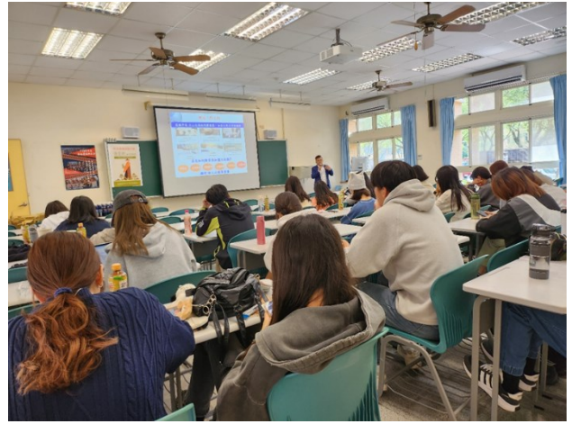
校友職場經驗分享(2)