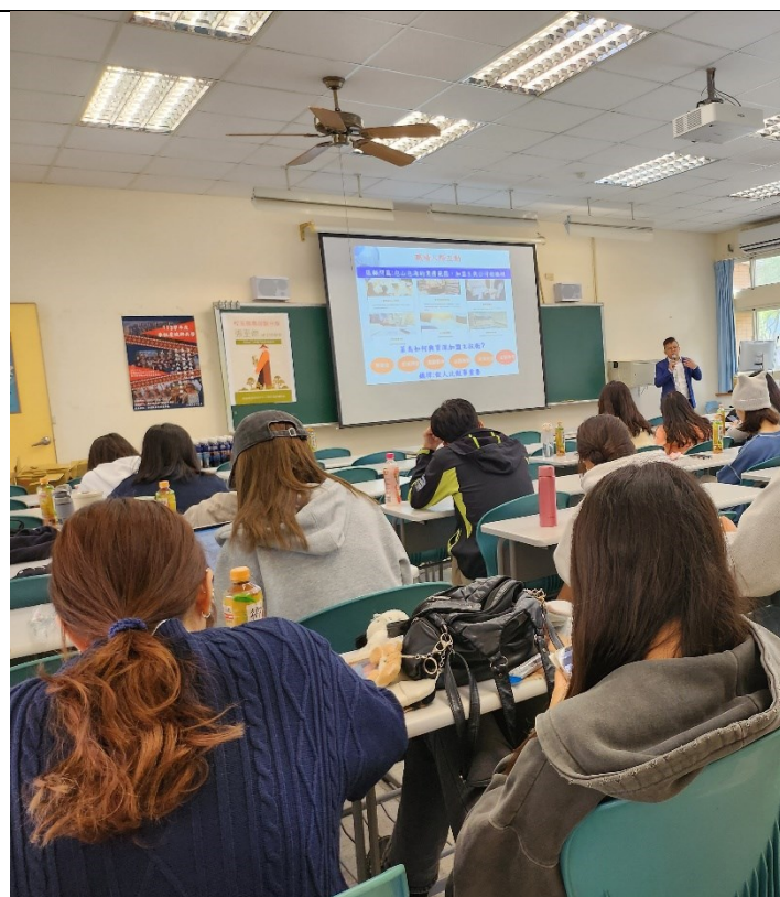
校友職場經驗分享(4)