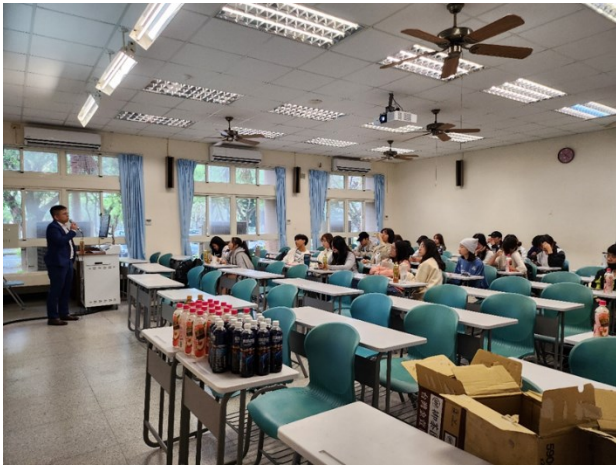
校友職場經驗分享(1)