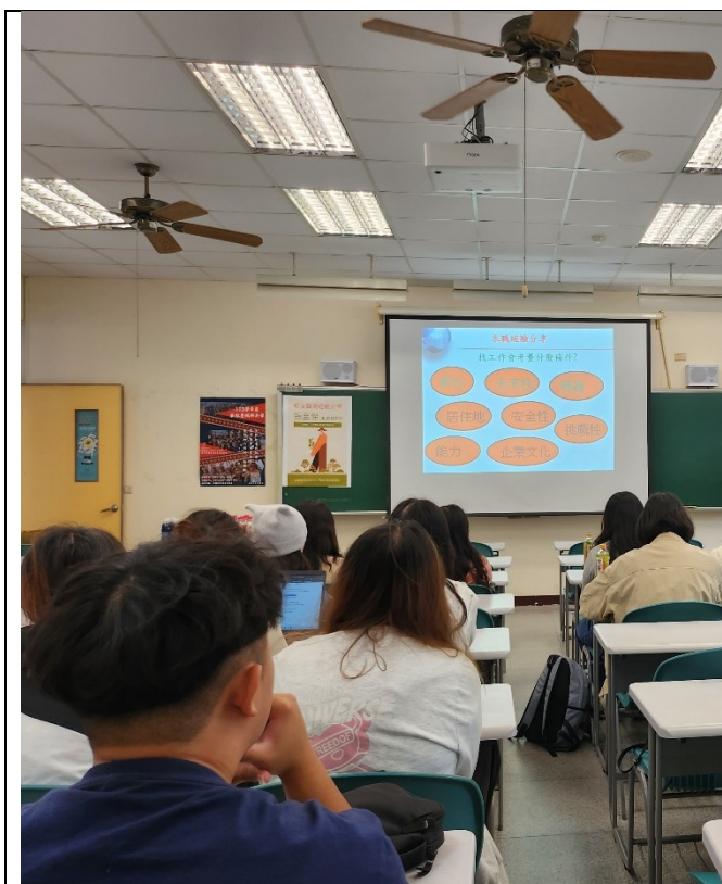
校友職場經驗分享(3)