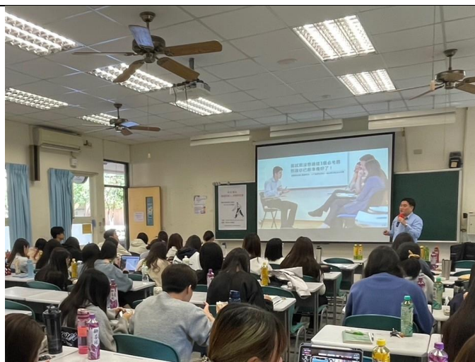
校友職場經驗分享(4)