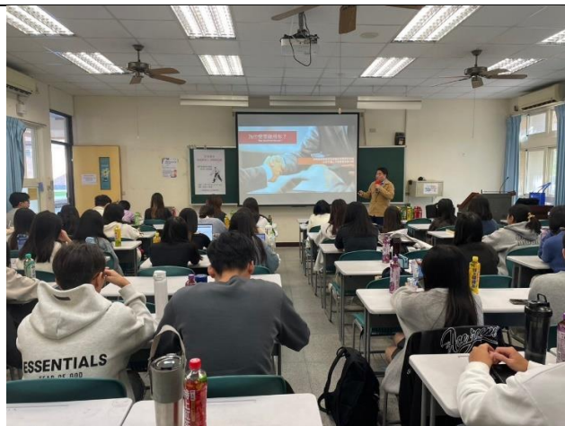
校友職場經驗分享(2)