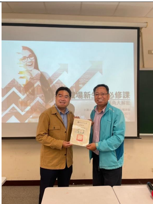
校友職場經驗分享(1)