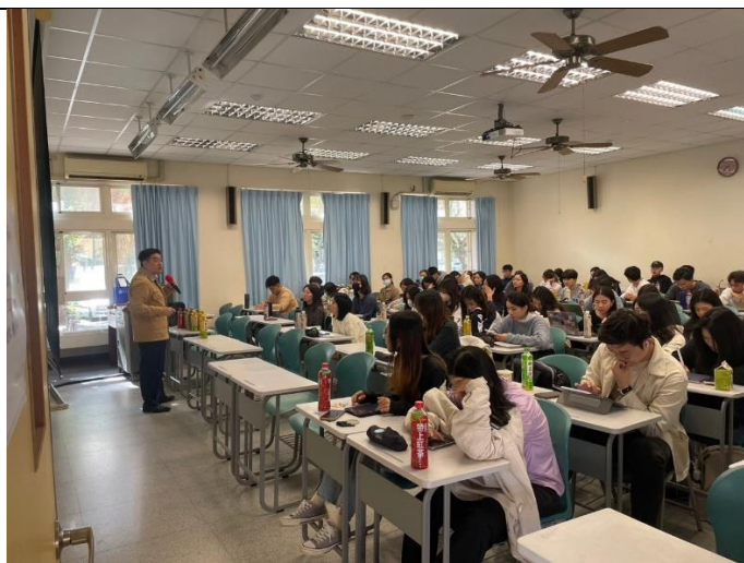
校友職場經驗分享(3)