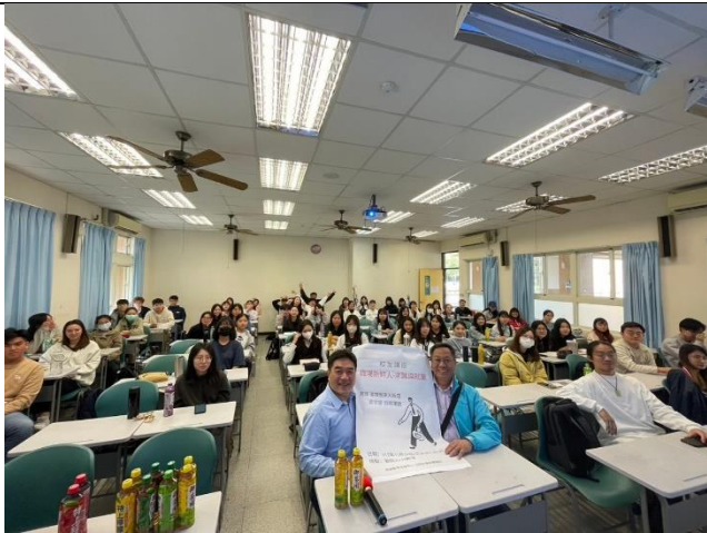
校友職場經驗分享(3)