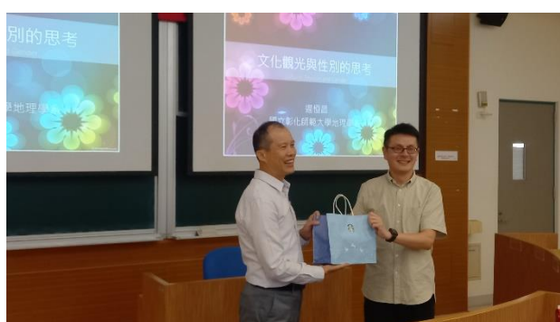
活動後講師與授課老師合影紀念。