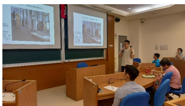
講師介紹博物館中與性別相關的館藏。