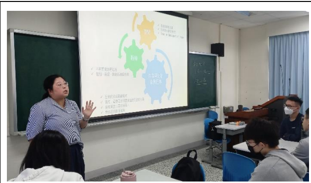
講師藉由介紹迷文化，帶入她作為寶塚劇團粉絲的故事。