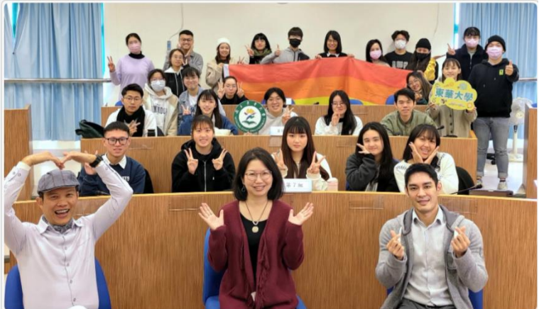
修課學生、評論教師合影

各組學生們分別出外實地考察，臺灣景點包括北投公園、西門紅樓、宜蘭傳藝中心、花蓮文創園區、東大門夜市、吉