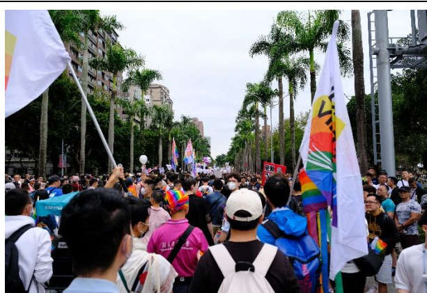
在東華的旗幟引導下，學生們加入隊伍。