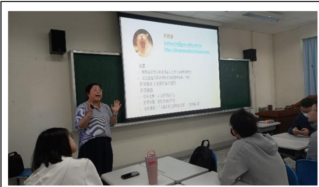
講師介紹其個人經歷。