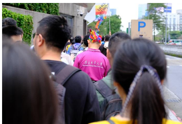
由授課老師代表東華通識課程參與遊行。