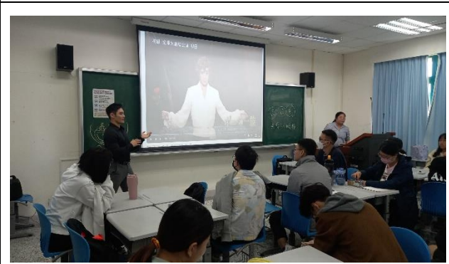
演講後由授課老師進行回饋。