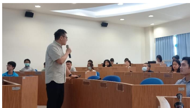
講師介紹與性別相關的藝文活動。