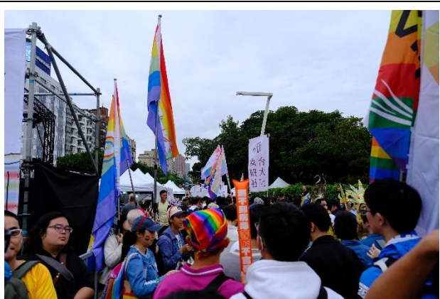
由老師帶領同學們參與。