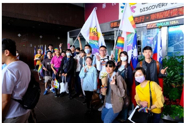
遊行前與所有東華大學參與同學合照。