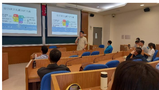
講師先就性別與文化觀光進行概述。