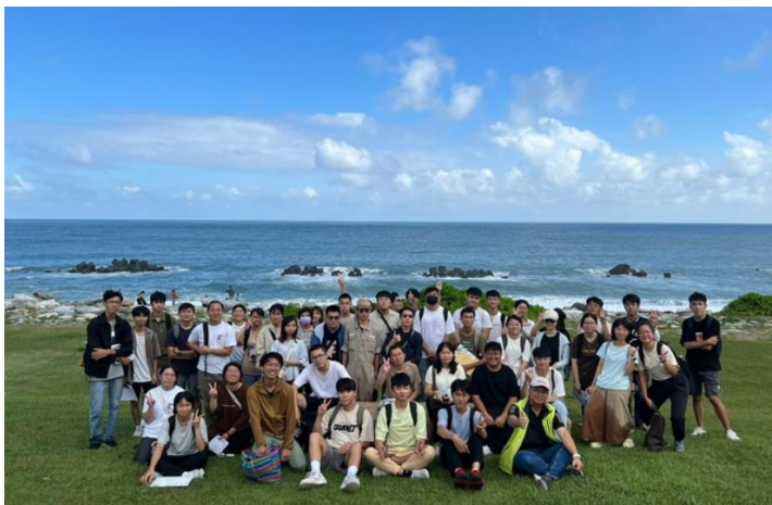
文化資產實察，師生在太平洋公園合影