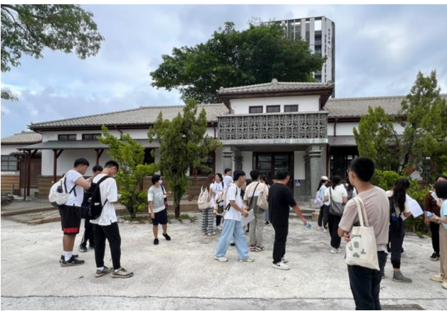
鐵道醫院文資修復保存解說