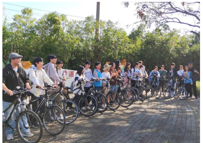
初音火車站前的單車考察