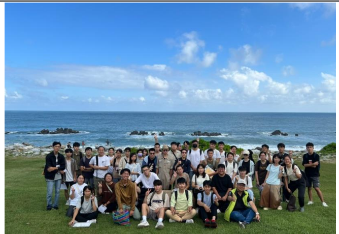
太平洋公園前師生合影