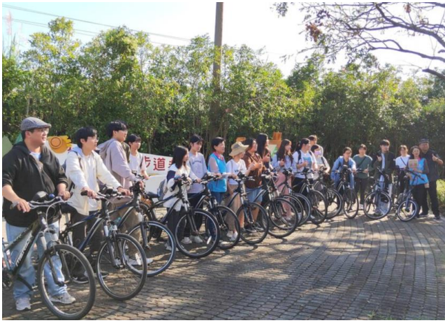
千城村單車考察活動