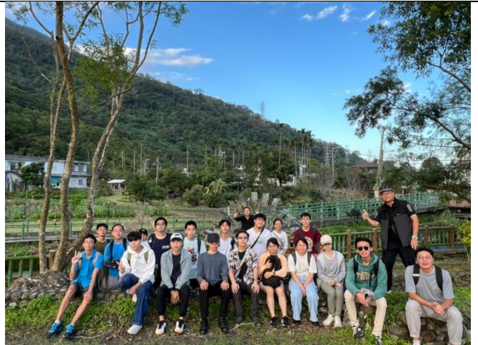
千城村五十甲公園考察