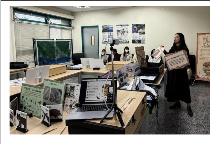
博物館進校園講座與教具箱展示