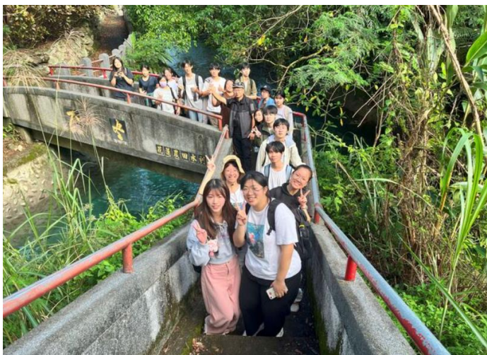
不盡跌水井前的考察合影