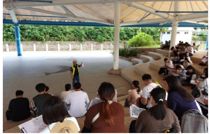
臨港線歷史廊道背景解說