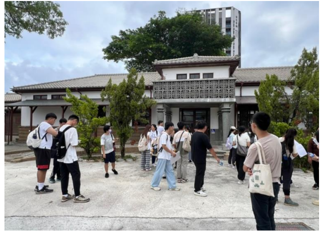
臨港線文化資產走讀活動，在鐵路醫院前解說