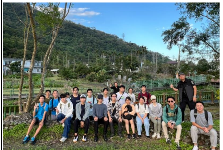
千城村五十甲公園前合影