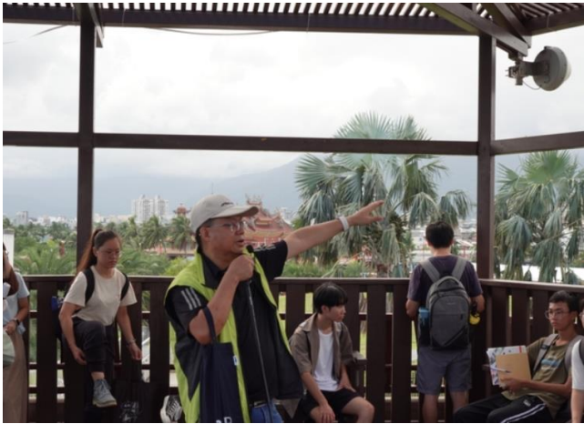
臨港線走讀，在觀景台解說花蓮鐵道發展史