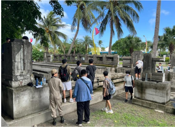
福住橋異地保存解說