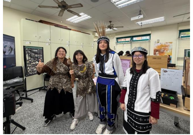
同學體驗考古教育箱的服飾