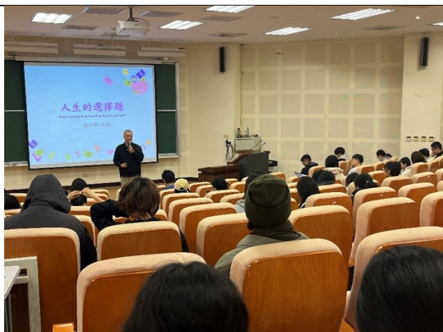
演講--人生的選擇題(更生人分享)