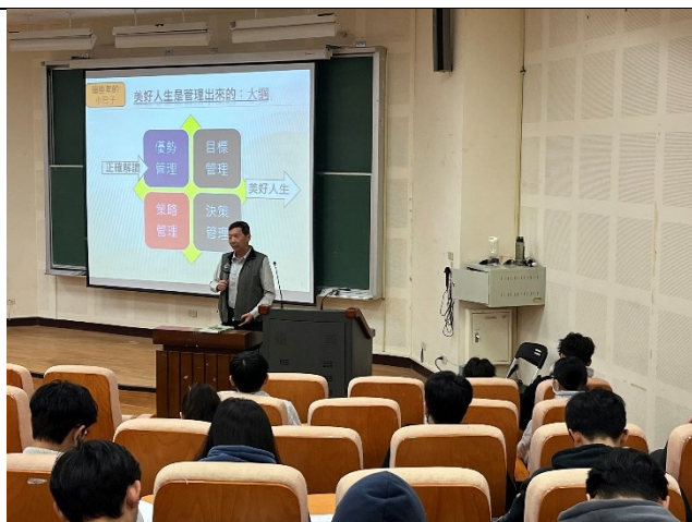
演講--美好人生是管理出來的