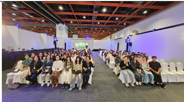
產學合作學習課程之專題分享