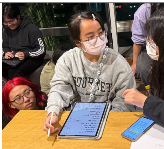
同學們彼此交換概念