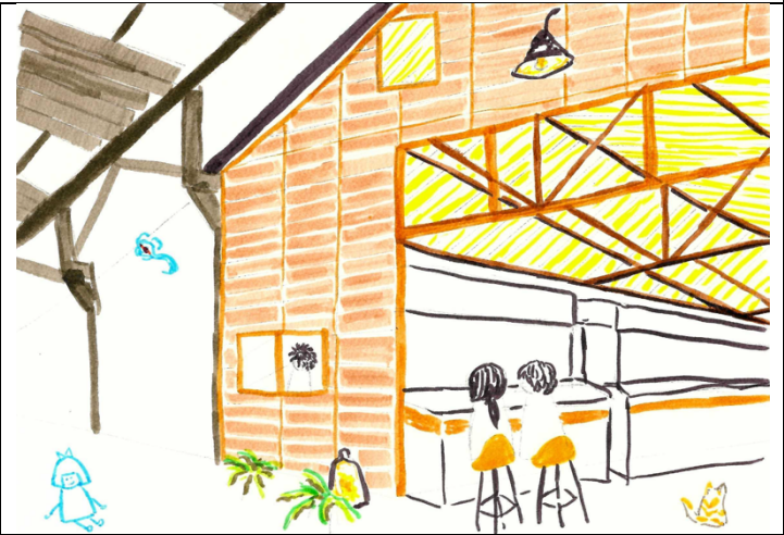
線上小說創作共寫截圖

《達戰惡鬼》 達，24歲，是個有靈異體質的大學生，個性因為靈異體質可以看到人們看不見的東西。舉例來說吧，灰塵就是灰塵但是他可以看到惡靈附著在灰塵上露出十分醜陋的面龐，最近在夢中，時常出現未知名的小孩，在夢中他趴地上，好像在畫著什麼，手不斷拿著畫筆在畫紙上擺動，雖然因為靈異體質這種情形見怪不怪，但最近一次夢境，似乎有意向我傳達某種訊息，往前傾身一看，一張發爛的紙上面，用蠟筆畫著一棵依著河邊，像麻將三索形狀的大樓，是身為高樓人，不可能認不出來的85大樓，受到好奇心的驅使，前往尋找蛛絲馬跡。 可是達不知道要如何前往他夢中的應許之地，剎那間，夢醒了。他來到他此生從未到過的地方，在他眼前矗立了一尊充滿神性的大佛，佛光普照，用著慈悲的眼神看著他。 佛說：「你終於醒來了，我知道你心中有一個疑問，想前往夢中出現的地方。」