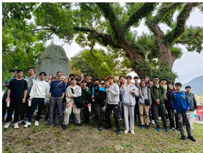
臺通修課同學與陳鴻圖教授兼教務長合照