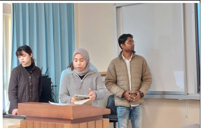
課堂分組辯論遊客直接 vs.間接管理議題看法