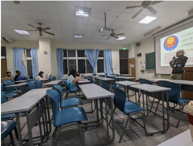
向同學提問對於在地學紀錄的想法