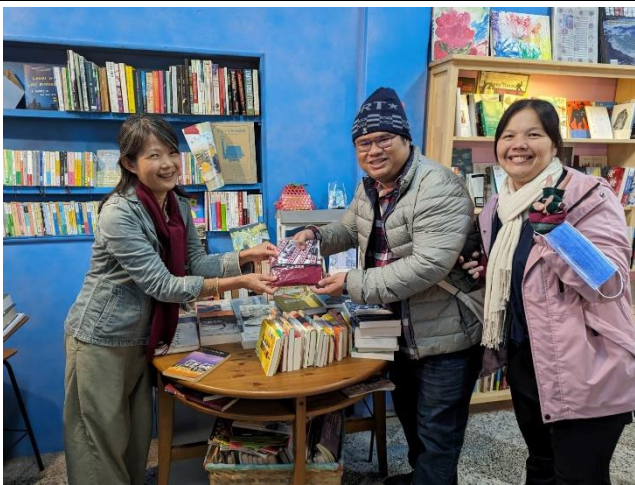
與鳳林新居民交流