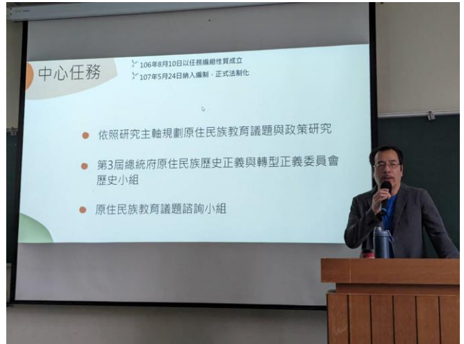
講者講述自身在原住民族教育之經歷