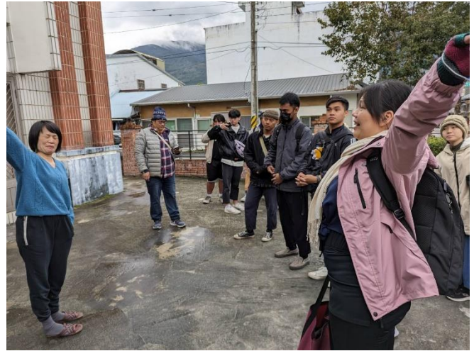
牧師講述鳳林歷史人文