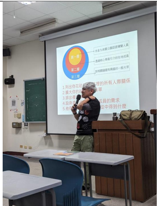
講述在地學紀錄的田野調查方法