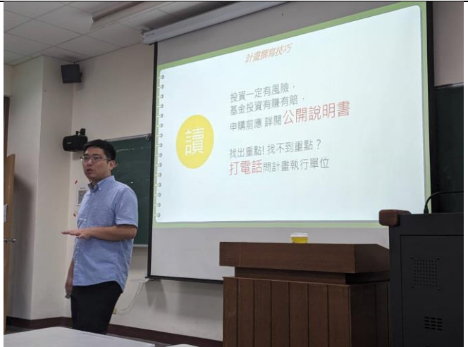
講述活動計畫執行技巧