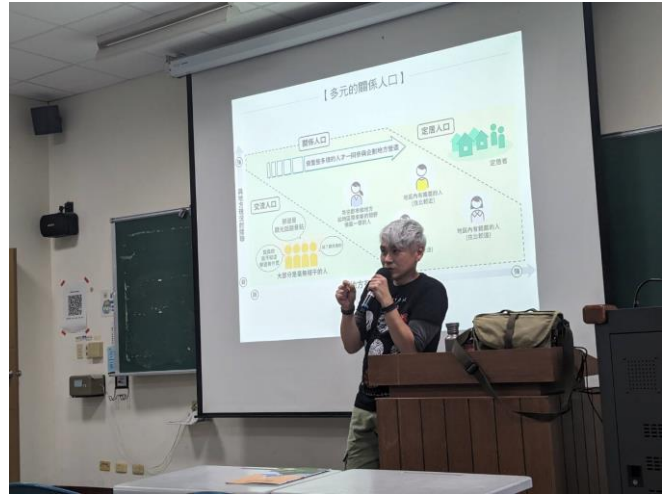
講述在地人口居民之間的關係