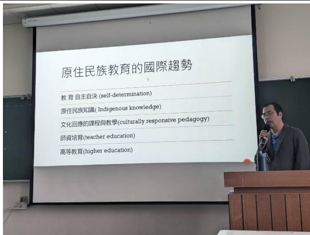
講者講述原住民族教育的國際案例