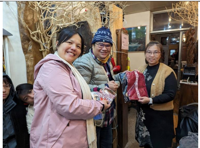
與鳳林老居民交流