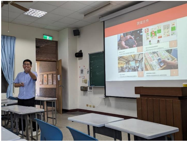
講述企業與在地合作