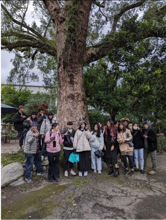
行程結束師生大合照