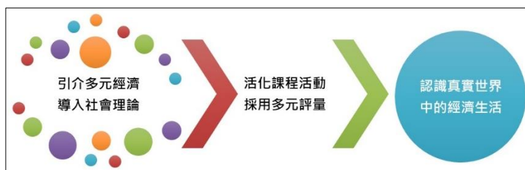
圖 經濟地理學課程之教學策略

本研究肯定學生具備建構自身的知識與價值體系之學習能量，並以此為前提去重新校準課程內容與調整教學方法。至於課程部份則根據前述文獻回顧中所整理的建構主義取向課程設計架構，制訂出經濟地理課程的教學策略：主題概念的講授著重將真實世界中的多元經濟案例導入經濟地理學相關理論中，讓學生透過海內外實務案例的解析，連貫性地理解經濟地理學的核心理論。課程活動除講授部份外，另設計多元的動態活動，透過情境化的課程活動，引導學生在合作協作當中，去體認經濟生活的運作機，並藉以深化經濟地理學的專業知能。學習評量則採取多元化的評量，提供學生自己掌握在各教學單位與課程活動的學習狀況。